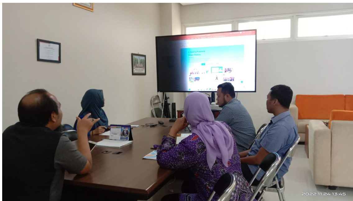
Persiapan Presentasi Website PPID Politeknik Negeri Madura dalam rangka Penilaian Mandiri Keterbukaan Informasi Publik (Kamis, 24 November 2022)