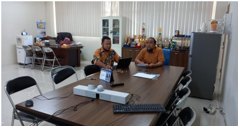
Presentasi Tim PPID Politeknik Negeri Madura terkait Penilaian Mandiri Keterbukaan Informasi Publik (Selasa, 29 November 2022)