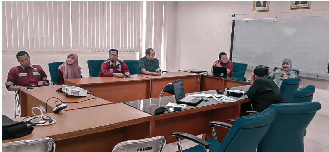
Rapat Koordinasi PPID Politeknik Negeri Madura (Selasa, 01 November 2022)