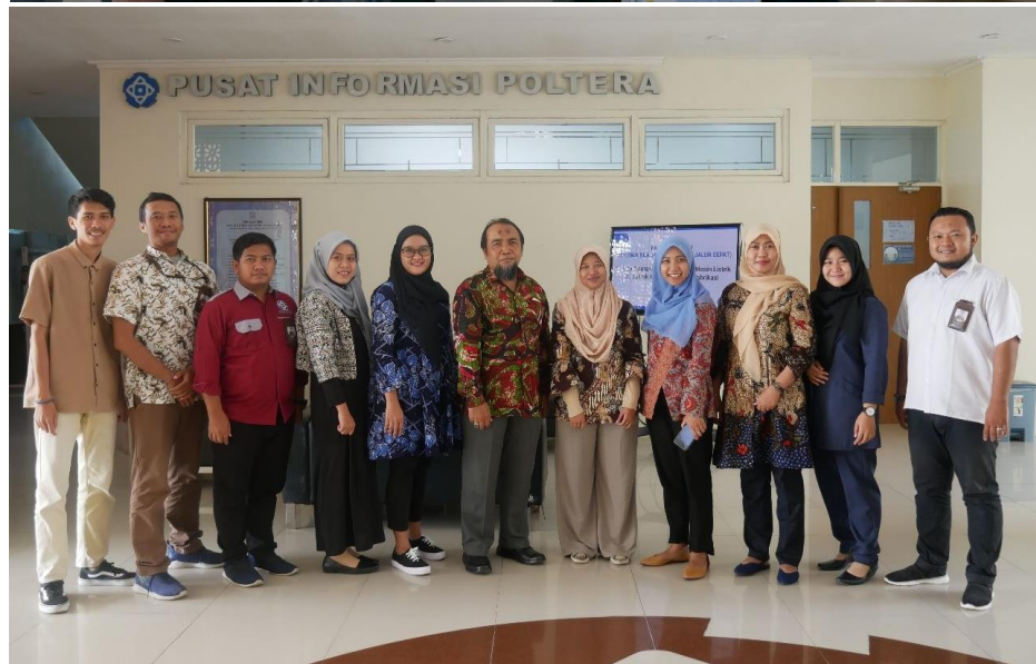
Visitasi Penilaian Mandiri Keterbukaan Informasi Publik Kemendikbudristek Tahun 2022 (Kamis, 8 Desember 2022)